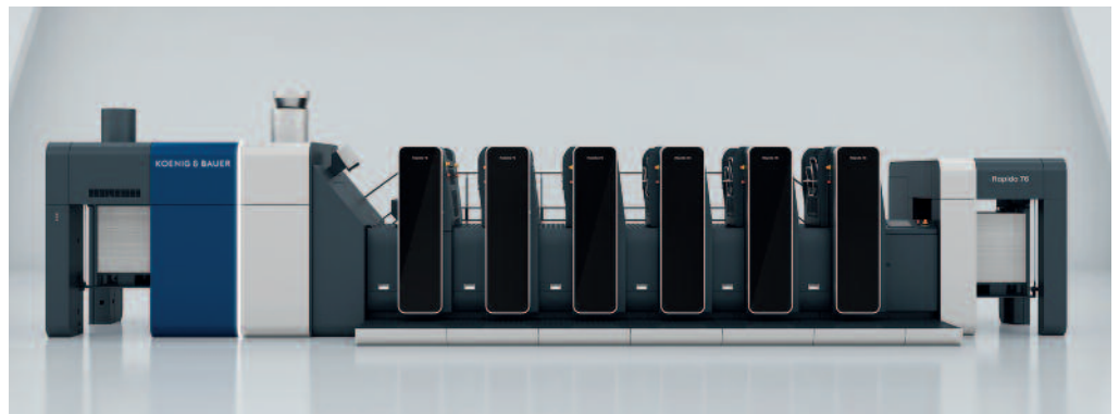
Die Rapida 76 gehört zu den produktivsten Bogenoffsetmaschinen im B2-Format. Auch ihre Bedruckstoffflexibilität ist beeindruckend. Die High-End Maschine mit fünf Farbwerken und zusätzlichem Lackwerk wird im Spätherbst bei Wallimann Druck & Verlag installiert.

Über die Jahre hat sich das Unternehmen mit heute rund 30 Mitarbeitenden vom traditionellen Buchdruck und Bleisatz zu einer modernen, mit zeitgemässen und innovativen Techniken ausgestatteten, regional führenden Druckerei entwickelt und sich einen ausgezeichneten Ruf für Qualität, Zuverlässigkeit und Partnerschaft erarbeitet. Dabei handelt Wallimann Druck & Verlag engagiert nach dem Leitsatz: «Drucken in der Region – mit Passion, bringt Emotion!».