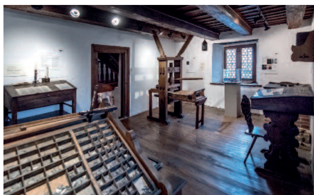
Die rekonstruierte Druckerstube von Helias Helye im Schlossmuseum Beromünster.