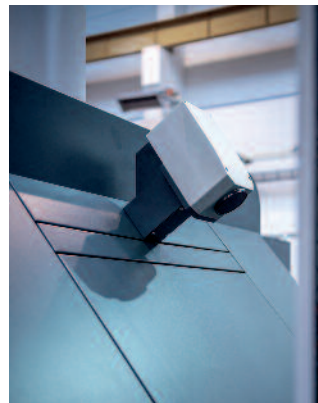
Die Kamera des QualiTronic ColorControl (Bild links) misst jeden Bogen und regelt jeden 10. Bogen. Die ziehmarkenfreie Anlage DriveTronic SIS arbeitet hochpräzise und ist eines der Unique Selling Points der Rapida 76 .

Die Rapida 76 ist mit dem vollautomatischen Plattenwechselsystem FAPC zur Verarbeitung ungekannter Druckplatten ausgestattet und kann vom Leitstand aus die Farbwerke auskuppeln. Darüber hinaus verfügt die Maschine über das schnelle und präzise Inline-Mess- und Regelsystem QualiTronic ColorControl ,