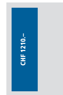
1/2 Seite hoch 93x257 mm