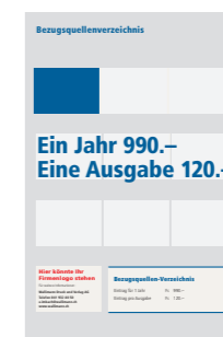
Bezugsquelle 85x41 mm