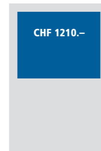
1/2 Seite quer 190x127 mm