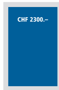
1/1 Seite 190x257 mm