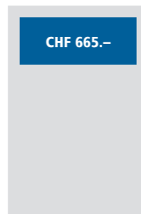
1/4 Seite quer 190x62 mm