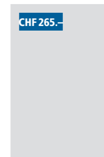
1/16 Seite quer 93x30 mm