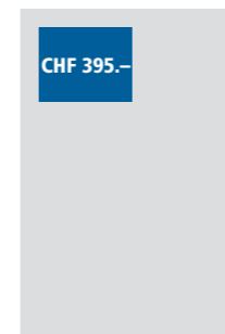
1/8 Seite quer 93x62 mm