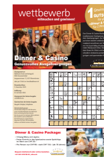
Rätselformat Auf Anfrage