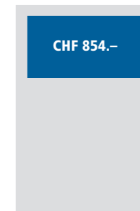
1/3 Seite quer 190x83 mm