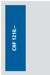
1/2 Seite hoch 93x257 mm