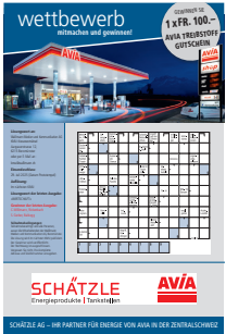
Rätselseite Auf Anfrage