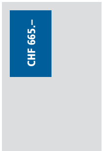
1/4 Seite hoch 93 x 127 mm