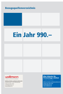
Bezugsquelle 85x41 mm